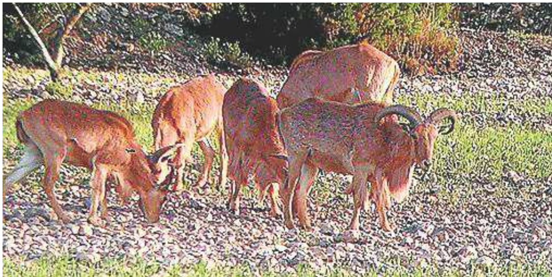
Imagen de un grupo de arruis alimentándose en una zona de monte.

Esta norma es consecuencia del recurso de varias organizaciones no gubernamentales a la sentencia del Tribunal Supremo dictada el pasado marzo. El fallo del Alto Tribunal modificaba la lista de especies catalogadas y anulaba varias disposiciones del Real Decreto 630/2013. Esta sentencia generó una gran preocupación por sus efectos económicos y sociales ya que, además de implicar la prohibición genérica de posesión, transporte, tráfico y comercio de ejemplares vivos de varias especies que son objeto de aprovechamiento piscícola o cinegético, supuso la imposibilidad de la práctica de caza y pes-