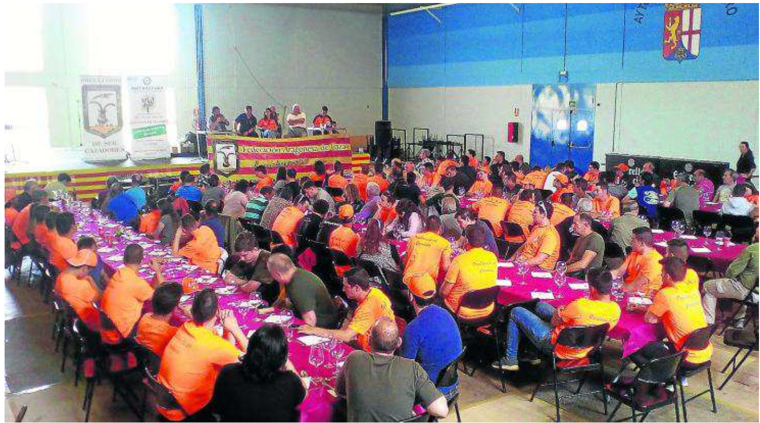
Asistentes a la primera jornada de convivencia de jóvenes cazadores que se celebró el 17 de junio en El Burgo de Ebro. JOCAR

El pasado domingo 29 de julio, los jóvenes de Jocar organizaron otro evento. Esta vez, el lugar elegido fue el campo de tiro La Torraza, de Frula. La asociación preparó una jornada de iniciación a los recorridos de caza, una