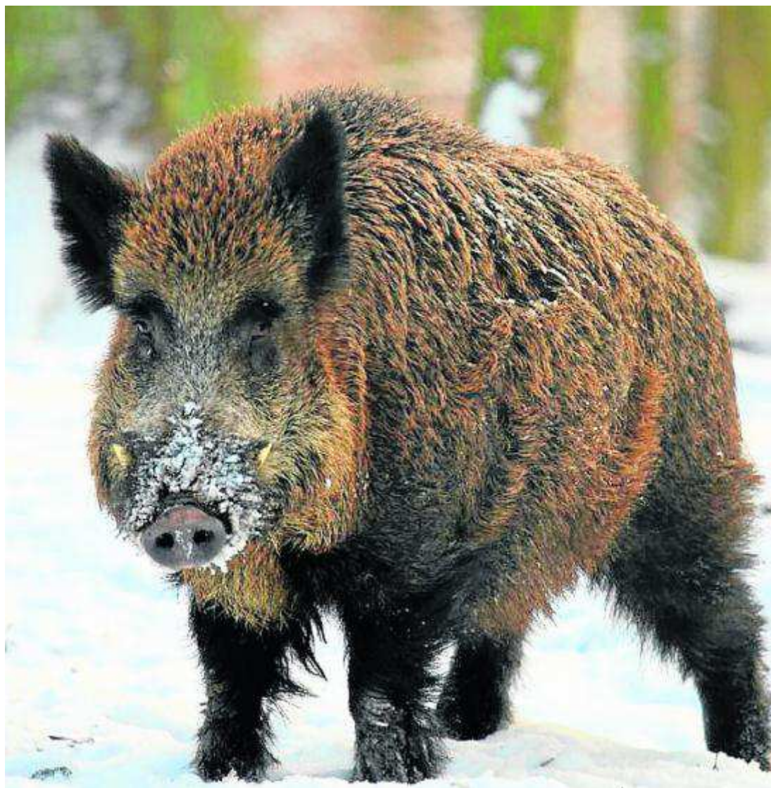
La llegada del virus de la PPA a España sería letal para el sector porcino y cinegético.

El sacrificio se convierte entonces en la única opción. La PPA afecta a cerdos de todas las edades, tanto domésticos como salvajes. La llegada del virus a nuestro país desencadenaría el desplome del comercio y la ex-