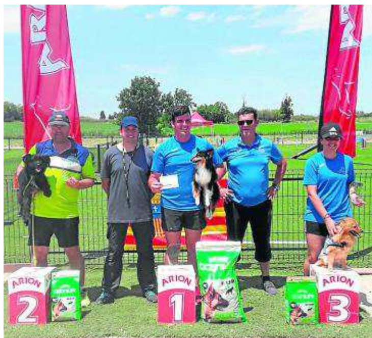
Ganadores de la categoría 40 del Campeonato de Agility. FAC

Díez, de Valencia, que diseñó unas pistas, tanto de agility (con zonas de contacto) como de jumping (sin zonas de contacto), muy fluidas a la vez que técnicas.