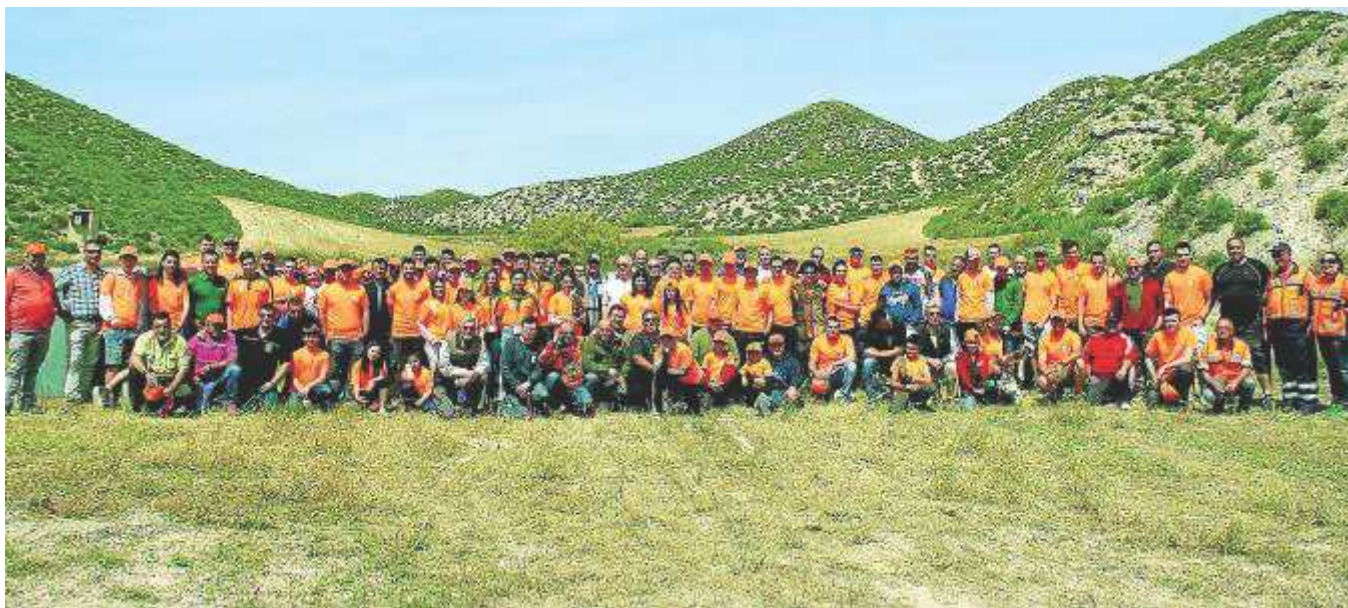
Foto de familia de los asistentes a la I Convivencia de Jóvenes Cazadores Aragoneses, el 17 de junio en El Burgo de Ebro. JOCAR