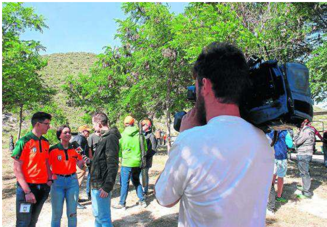
Aragón Televisión grabó un reportaje durante la jornada en El Burgo de Ebro. JOCAR

Decenas de jóvenes de las tres provincias ya forman parte de Jocar, que espera cerrar este año con la nada desdeñable cifra de doscientos asociados a los que les sobran las ganas de trabajar por el futuro de la caza en Aragón. FAC