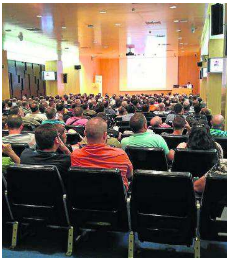
El curso que se celebró en Zaragoza llenó el aforo.