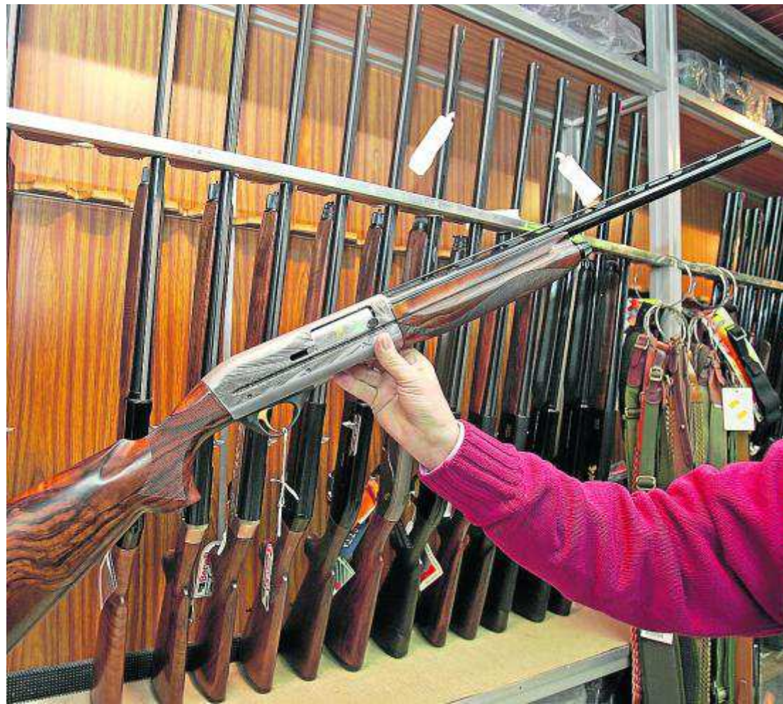
Según el borrador, las escopetas deberán estar guardadas bajo llave incluso en el propio domicilio. HERALDO

«No comprendemos este cambio de actitud después de habernos hecho perder el tiempo durante casi un año en una veinte-