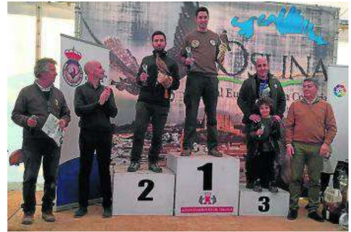
Podio del Campeonato de España de Cetrería. RFEC