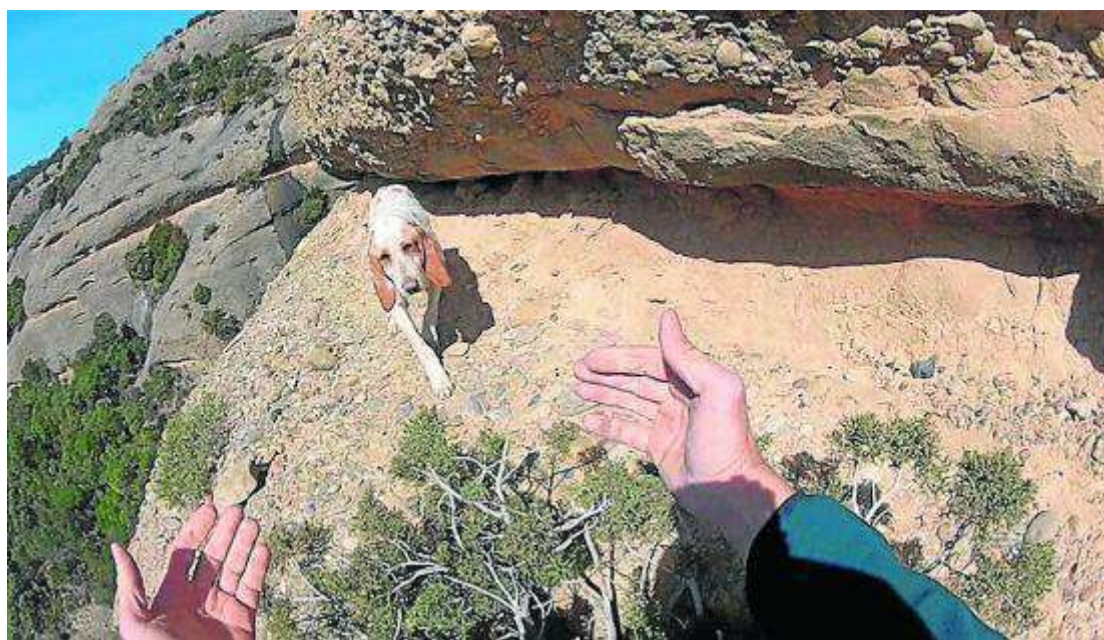
Imagen de un rescate de unos perros que se habían quedado enriscados en la sierra de Guara.