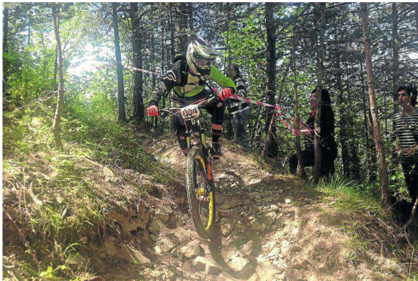
Imagen de archivo de una prueba de bicicleta extrema de montaña, popularmente conocidas como BBT.