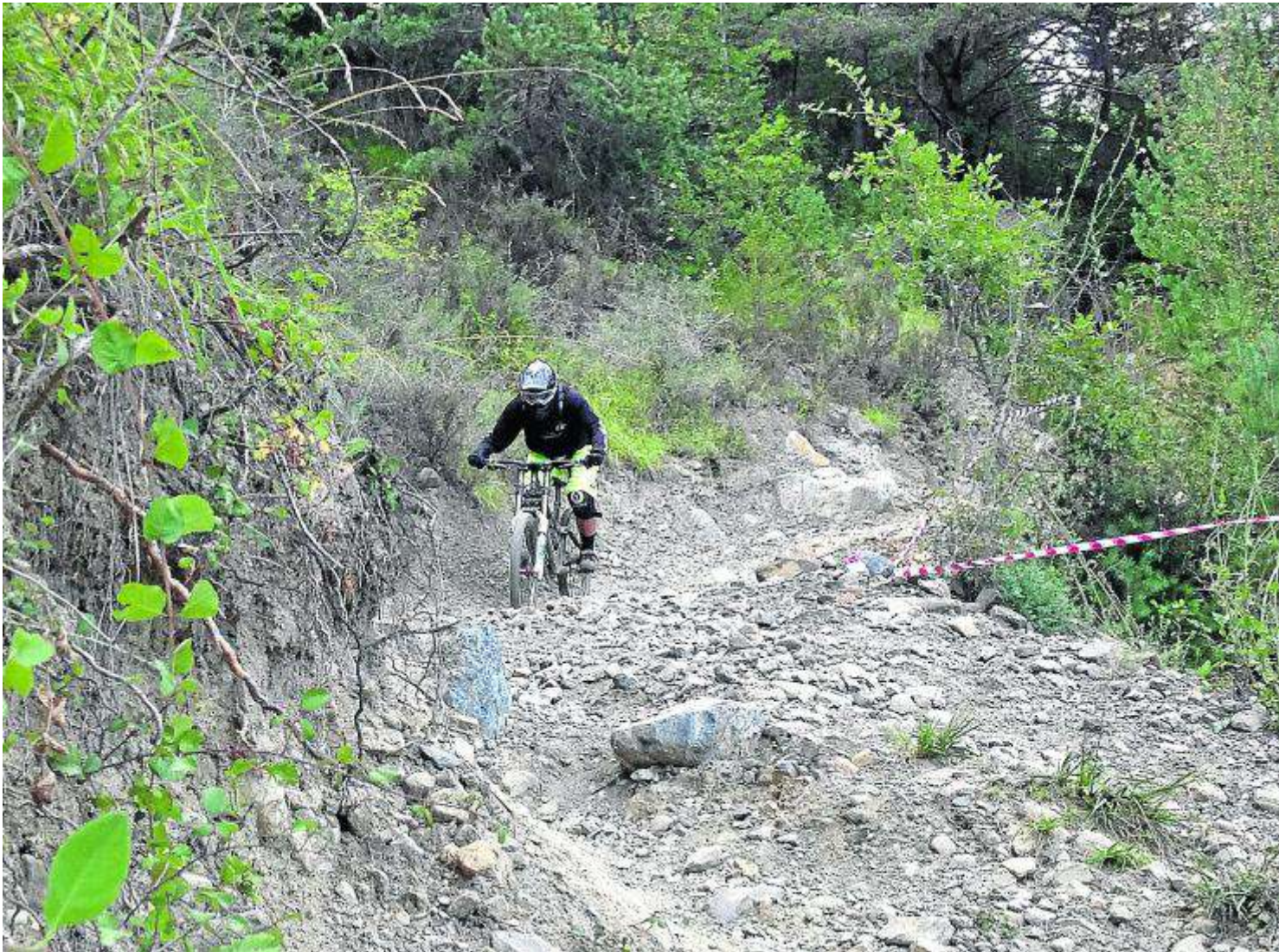
Un aficionado a la bicicleta de montaña extrema realiza un descenso.

PREVENCIÓN La intención de la sociedad de cazadores de Boltaña es que se tomen medidas preventivas, «antes de que se produzca algún accidente grave». Desde su punto de vista, «en el monte, cabemos todos». Este problema comenzó a denunciarse en 2016