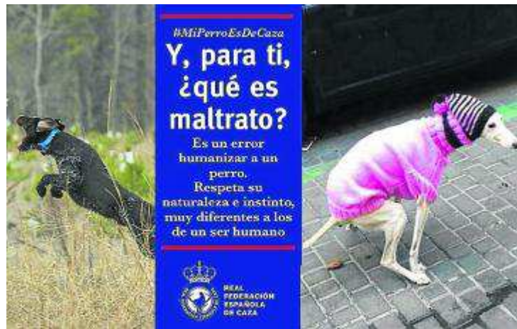
Imagen de la campaña promocionada por la RFEC.