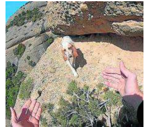
Imagen de archivo de un rescate.