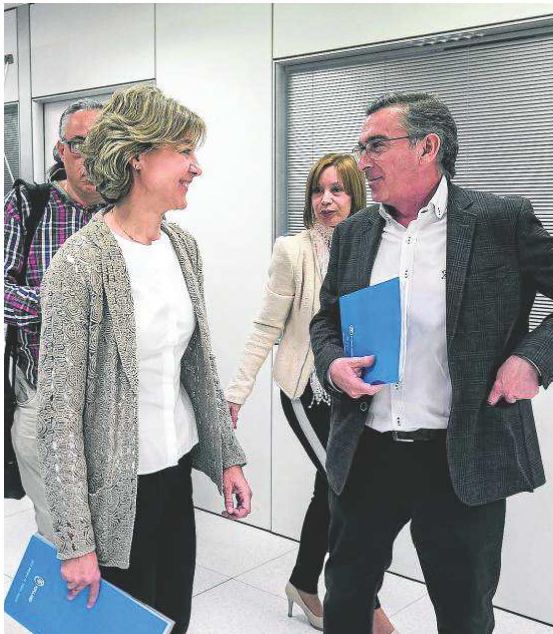
Luis María Beamonte, presidente regional del PP, junto a la exministra de Agricultura, García Tejerina O. DUCH

«La primera batalla que debemos dar para acabar con la despoblación es la de generar un clima de mayor comprensión hacia todas las actividades ligadas a nuestro mundo rural»