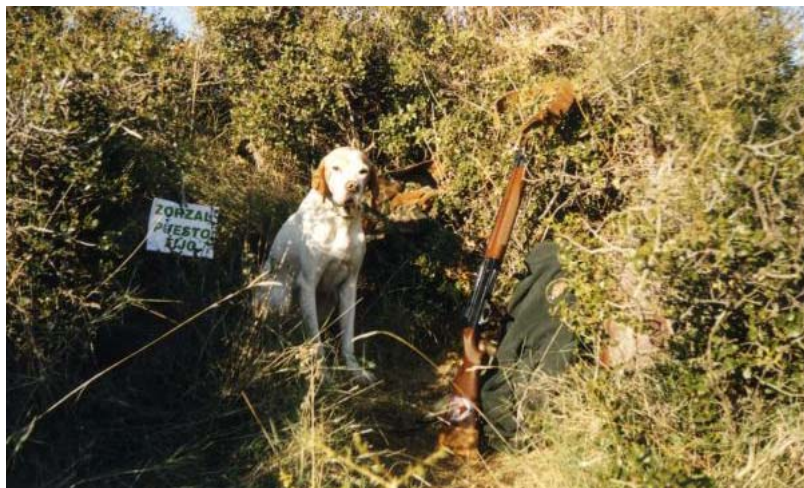
Imagen de un puesto para la caza de zorzales.