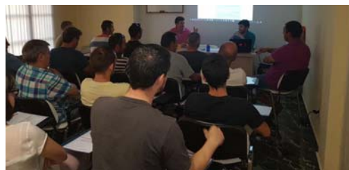
Un momento del cursillo de bienestar animal. FAC