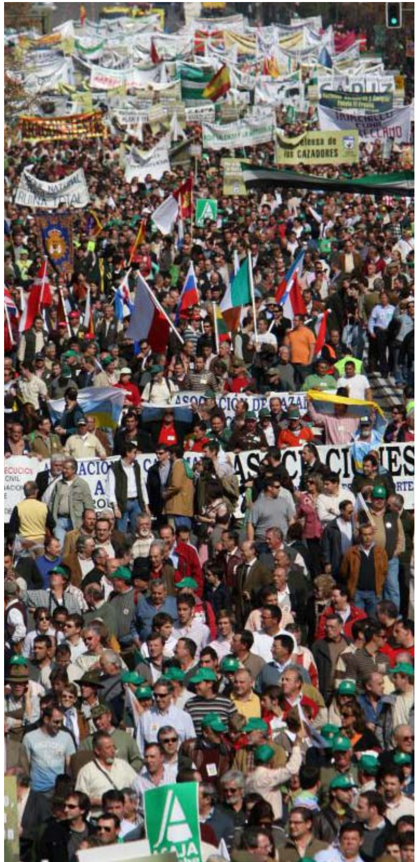
Imagen de la manifestación de cazadores del año 2008, en Madrid.

Simplemente han aprovechado los 'huecos' de la ley 42/2007 para hacer daño a los cazadores y a los pescadores de este país sin pensar en las consecuencias,