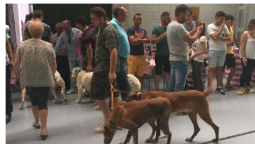
Un momento de la feria de Terrel.