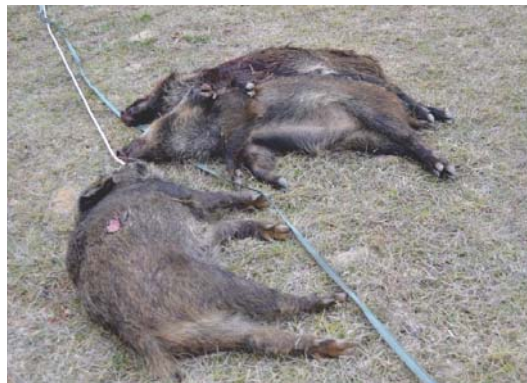
Imagen de varios ejemplares de jabalí abatidos en una cacería.