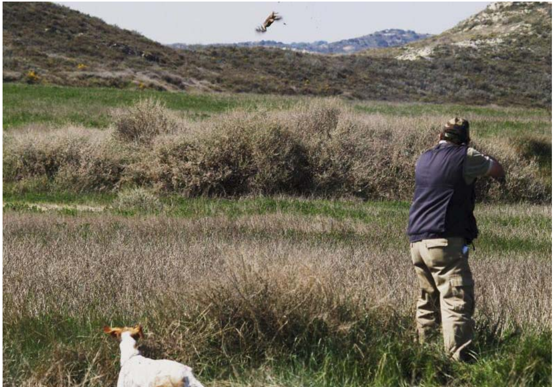
En la caza menor, el faisán también está considerado especie exótica.

Para todas estas especies alóctonas, su futuro en nuestro país resulta de tinte negro. De acuerdo con los preceptos establecidos en la ley de Patrimonio Natural y de la Biodiversidad, están llamadas a ir desapareciendo de nuestros ríos y montes poco a poco, de forma paulatina, conforme se van tomando medidas en este sentido, sea por medio de la actividad de los cazadores y pescadores o por la acción directa de las administraciones.