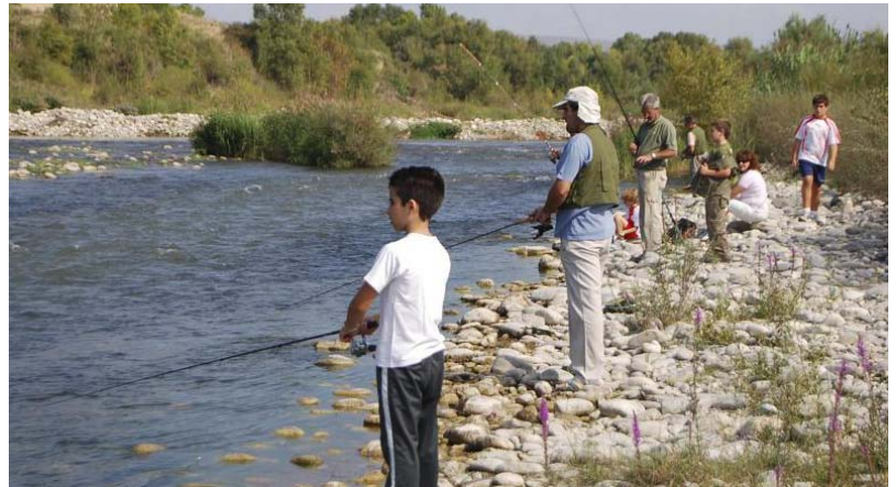
Cursillo de iniciación a la pesca en el río Cinca. JOSÉ LUIS PANO