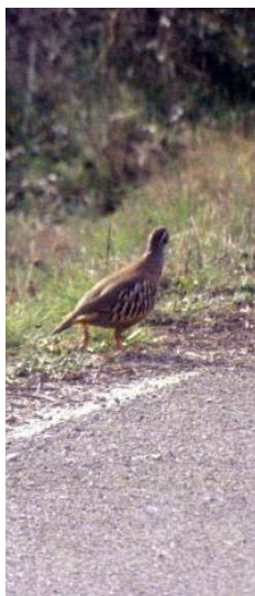
Perdiz roja.