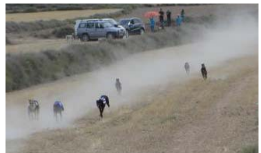
Un momento de las carreras de galgos.