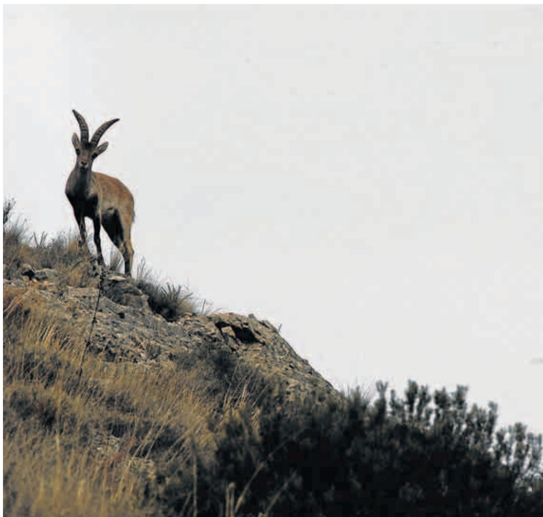
La cabra hispánica que habita en Aragón sigue libre de sarna.

La monitorización de algunas cabras en años anteriores ha permitido conocer que sus movimientos por el territorio son amplios, y que en sus desplazamientos por el hábitat que le es natural cubre considerables kilómetros. De ahí, el temor a que cabras de la parte de Gandesa puedan tener contacto con ejemplares de Beceite, Valderrobres o de otros núcleos del Maestrazgo. En todo caso, este hecho, a esta fecha, no se ha pro-