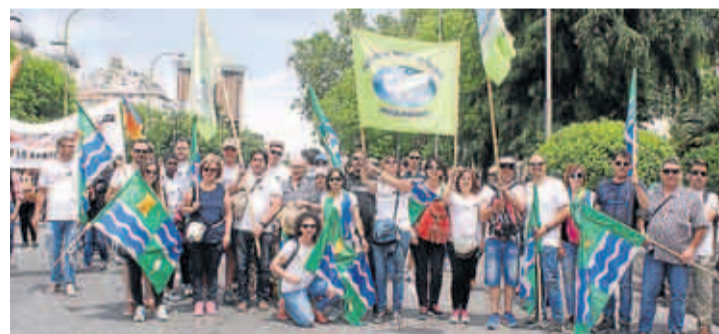
Los asistentes, muchos de Aragón, con pancartas muy reivindicativas.

La plataforma continúa coordinando las acciones que las federaciones de pesca están llevando a cabo para lograr que se paralice, en la medida de lo posible, el cumplimiento de una ley que, según esta entidad, pondría en jaque la viabilidad de miles de empresas relacionadas con el mundo de la pesca, que pueden verse obligadas a cerrar con la consiguiente pérdida de miles de puestos de trabajo dentro de este sector. A. E.