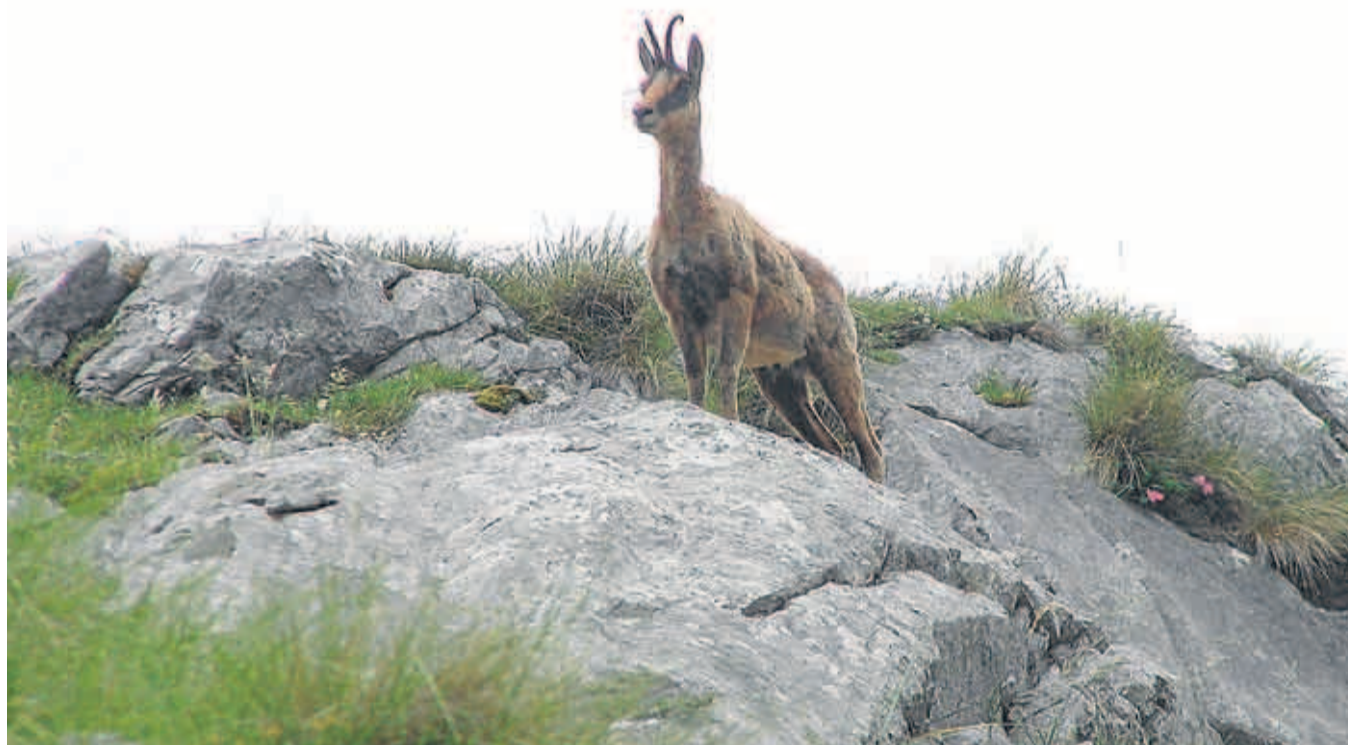
Ejemplar de sarrio del Pirineo aragonés, donde el último individuo con pestivirus se localizó en marzo de 2015.