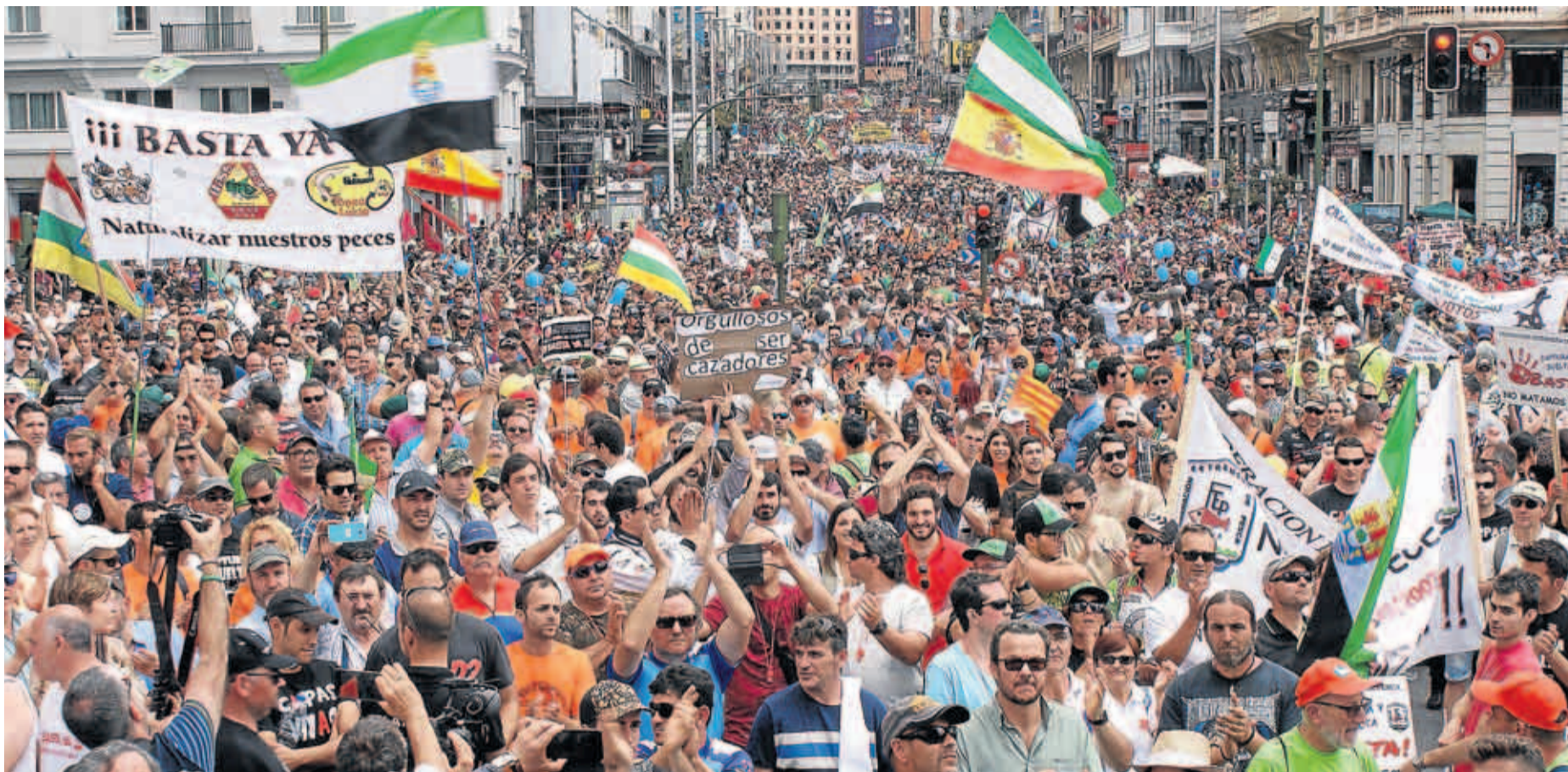
Miles de personas salieron a la calle para mostrar su descontento con la última decisión de los jueces del Supremo.

150.000 Pescadores, cazadores y gente del mundo rural, se reunieron en Madrid, el 5 de junio, para pedir la eliminación del Catálogo de Especies Invasoras