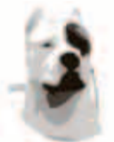
American Staffordshire Terrier