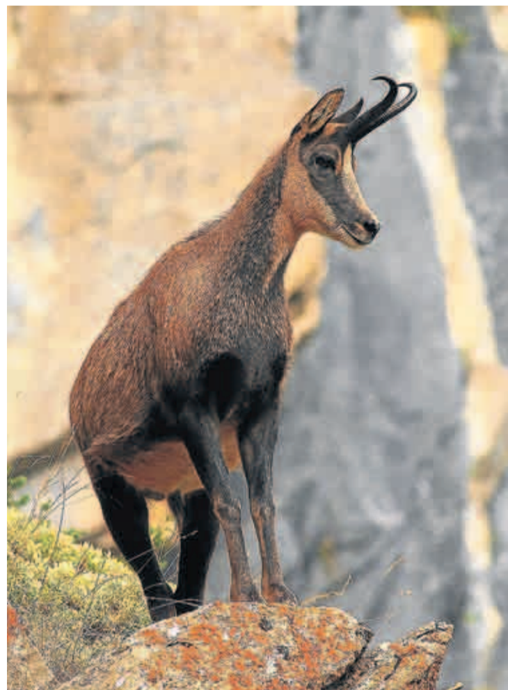
Desde 2012, la caza del sarrío ha estado muy restringida.

consensuados en las juntas consultivas, enseguida aprobó restricciones a la caza del sarrío. Modificó cupos e incluso prohibió la captura de este ungulado antes de lo estipulado en la orden de vedas. Durante estos años, los permisos se han centrado, sobre todo, en machos de trofeo de la propiedad (subastas de los ayuntamientos). Para esta temporada, está prohibida la caza de hembras acompañadas por crías del año y de ejemplares menores de dos años. Las modalidades de caza permitidas son a rececho y rastro. J.M.T.