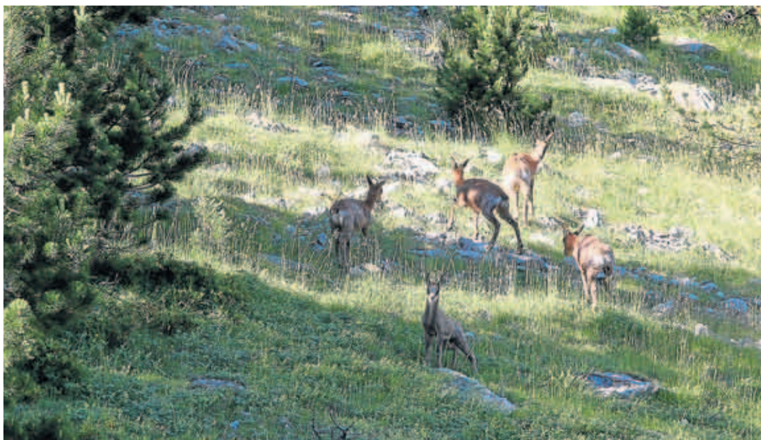
Grupo de sarríos, en una imagen de archivo.