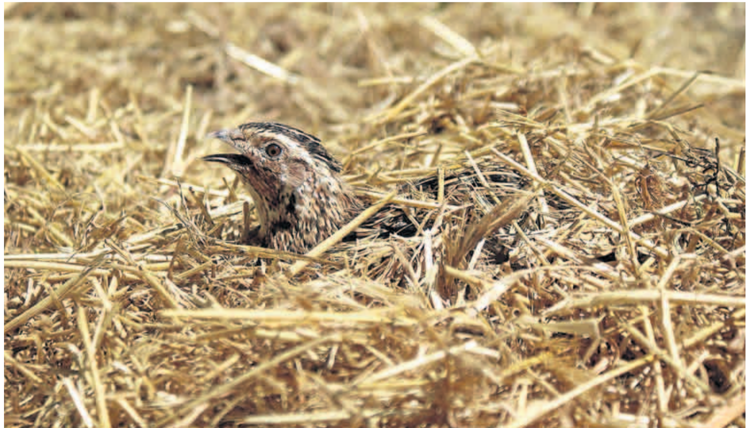
La presencia de codorniz en los secanos tiende a disminuir con las nuevas maquinarias y prácticas agrícolas.

PREVISIONES Las perspectivas para la caza de la codorniz son aceptables en la provincia de Zaragoza, mientras que en Huesca y Teruel se habla de mala campaña. Abunda, en cambio, la paloma torcaz, que se ha extendido por prácticamente toda la Comunidad. Por su parte, la tórtola atraviesa por una situación similar a campañas precedentes. Allá donde se permiten batidas de conejo, se esperan buenas jornadas venatorias