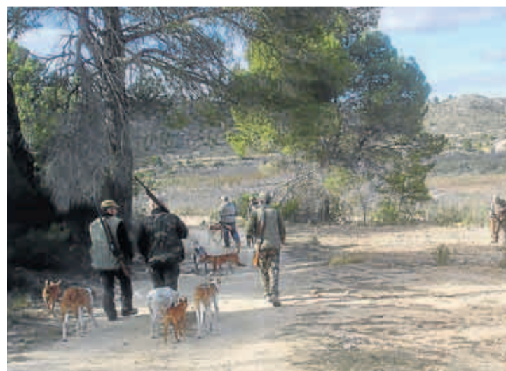
Se formará a uno o varios miembros de cada cuadrilla de caza.

cado animales de caza silvestre destinados al consumo humano. De este modo, los cazadores realizan un primer examen sobre el terreno. Así pues, se formará a uno o varios miembros de las cuadrillas de caza para poder reconocer en una primera revisión posibles alteraciones patológicas o lesiones de los animales abatidos, antes de que puedan ser usados para consumo particular de la cuadrilla. Caso de detectar que alguna parte del animal presente un estado sospechoso, se enviará para ser analizada por un veterinario.